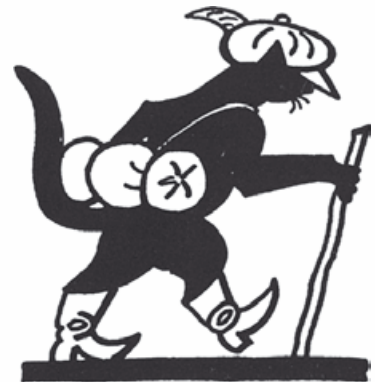
Upraveno podle knihy Josefa Lady Mikeš.

Byl unavený. a když uléhal do křoví do pelišku, jen si vzdychnul. „Ó, babičko zlatá, kdybyste věděla, co jsem si kvůli tomu krajáči už vytrpěl.“ Četník už se Mikeš nebál, a tak se rozhodl, že půjde do většího města, kde už lidé jsou zvyklí vidět všelijaké divy. Tam se mu snad podaří vydělat nějaké peníze a pak se bude moct vrátit domů. U Mukařova ho málem spláchl bouřkový příval, ale zachránil ho cirkus Kludský, který ho angažoval jako mluvící pytel Žok-Žok. Ale nebojte se, děti, pak už se opravdu černý kocourek vrátí konečně domů do Hrusic, kde ho pořád nedočkavě vyhlíží Pepík Ševců, kozel Bobeš, Pašík, babička a všichni jeho ostatní kamarádi.