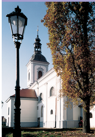
Kostel sv. Petra a Pavla