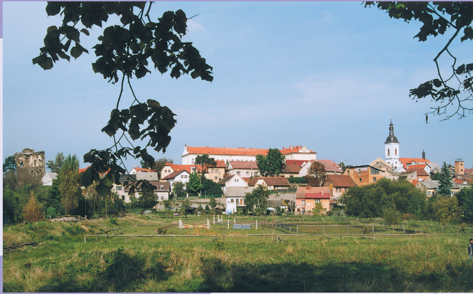
Pohled na Říčany