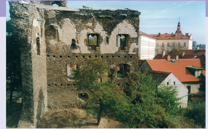
Zřícenina říčanského hradu