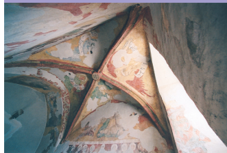
Fresky v kostele sv. Petra a Pavla