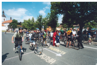
Start cyklistického závodu