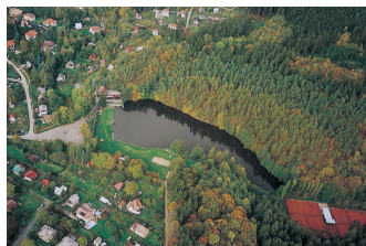
Příroda v Říčanech

kdy ho dobyli husité. Říčanský hrad představoval ojedinělou miniaturu královského hradu s obvodovou zástavbou.